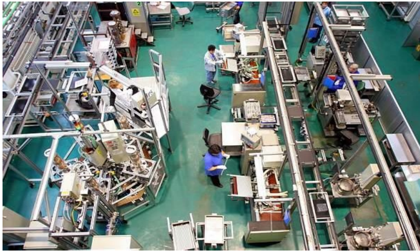
Figura 2. Vedere din sectia de asamblare a combustibilului nuclear la FCN Pitesti

de tip CANDU 6, precum si tehnologia industrială pentru producerea apei grele. Prima incarcatura de apa grea necesara Unitatilor 3 si 4 este deja fabricata, aflandu-se in proprietatea Statului roman si a SNN.